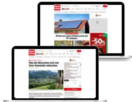
BILD & TEXT TEASER AUF KRONE.AT BUNDESLAND-STARTSEITE mit Verlinkung auf krone.at/Sonderthemen . Hier gehts zur Website.