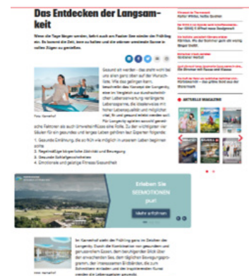
BILD & TEXT TEASER AUF KRONE.AT BUNDESLAND-STARTSEITE mit Verlinkung auf krone.at/Sonderthemen . Hier gehts zur Website.

Ab Erscheinung Print, spätestens nach 72 Stunden online.