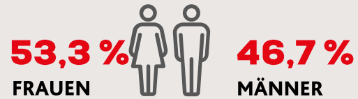
Strukturwerte in %

Die „Krone“ erreicht ein vielseitig interessiertes Publikum und profitiert von einer treuen Leserschaft.