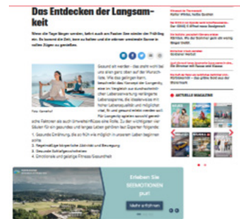
BILD & TEXT TEASER AUF KRONE.AT BUNDESLAND-STARTSEITE mit Verlinkung auf krone.at/Sonderthemen . Hier gehts zur Website.

Ab Erscheinung Print, spätestens nach 72 Stunden online.